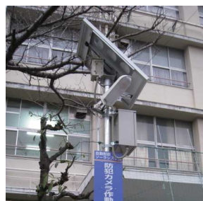
大阪市長吉六反連合町会