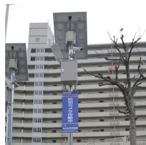
大阪市喜連東連合振興町会