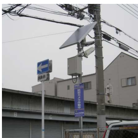
大阪市加美北連合町会